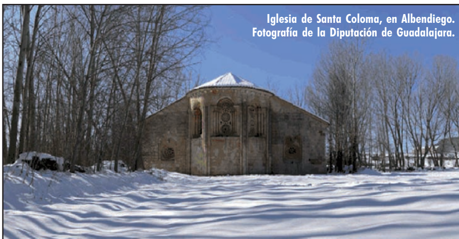
Iglesia de Santa Coloma, en Albendiego. Fotografía de la Diputación de Guadalajara.

notorio por ser el templo que está en mucho peor estado que los demás que hay en el Plan, quienes visitaron el templo dejan constancia de la dificultad de llegar «por caminos casi inaccesibles», pero no mencionan la inscripción «Guilem fecit» que hay. Algunos de estos templos, mismamente Villaescusa, tienen dibujos de su planta en la bibliografía que cita la Enciclopedia del Románico en Guadalajara . No son las únicas iglesias de las que faltan los planos (Henche, Matas, Morillejo, El Sotillo, Valdeavellano...), un hecho común, aunque no necesariamente en los mismos templos en otras obras sobre el románico de Guadalajara menos extensas.